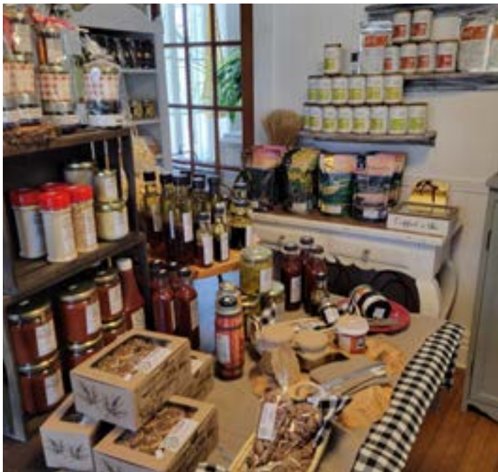
Présentoir de produits agroalimentaires

L'arrière-boutique, un espace chaleureux et lumineux a été créé pour offrir les services de coiffure, soins du visage, électrolyse, soins des pieds, massothérapie et traitement des varicosités par une infirmière spécialisée. Ces associées désirent que leur projet d'affaire évolue selon les besoins de la clientèle, même être à l'affût des nouvelles tendances. Elles veulent aussi développer davantage l'agroalimentaire car cette demande est très populaire auprès de la population locale. De plus, elles prévoient de belles nouveautés pour le 1er anniversaire qui aura lieu le 12 juillet 2023 sous forme de 4 à 7. Surveillez la page Facebook Maison Libra pour connaître les détails.