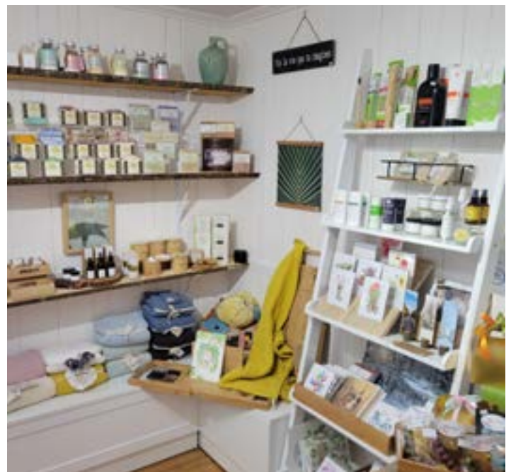
Présentoir de cartes de souhaits.

Depuis l'ouverture de la boutique en juin 2022, l'offre de produits a plus que doublé. Mesdames Gagnon et Poulin mettent en marché les produits de plus de quarante-cinq (45) entreprises québécoises. Un vaste choix d'idées cadeaux vous attend : carte de souhait à planter, bougie soya avec mèche de bois, savonnerie, diffuseur d'huiles essentielles, linge de maison, céramique, produits d'entretien bio pour la maison, etc... De plus, elles sont particulièrement fières d'être un distributeur des Bijoux Mia. Finalement, la section agroalimentaire propose plusieurs produits de l'érable, du miel biologique, du chocolat, des vinaigrettes, des marinades, des terrines, des rillettes, des micros pousses, du café et des tisanes curatives.