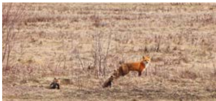
Petite famille de Beaumont.