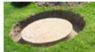
Exemple d'un couvercle bien dégagé

Prenez note que nous ne pouvons déterminer à l'avance la journée exacte de la vidange de votre fosse.