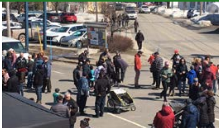
Un franc succès pour la journée du Temps des sucres.