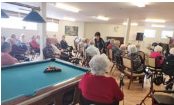
80 participants à l'activité du mois de mars au Manoir du Coteau